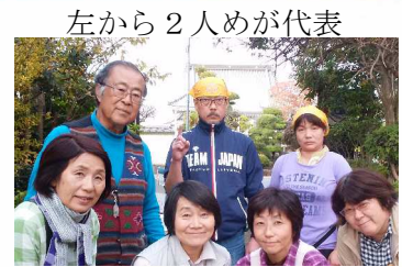
左から2人目が代表

昨年2月26日、心臓のバイパス手術を受け、成功。 それまで苦しんでいた不整脈をはじめとする心臓病に 大きな改善がみられるようになりました。人工透析を 続けながら、体力保持に努めております。