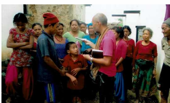
足の不自由な男の子と村人